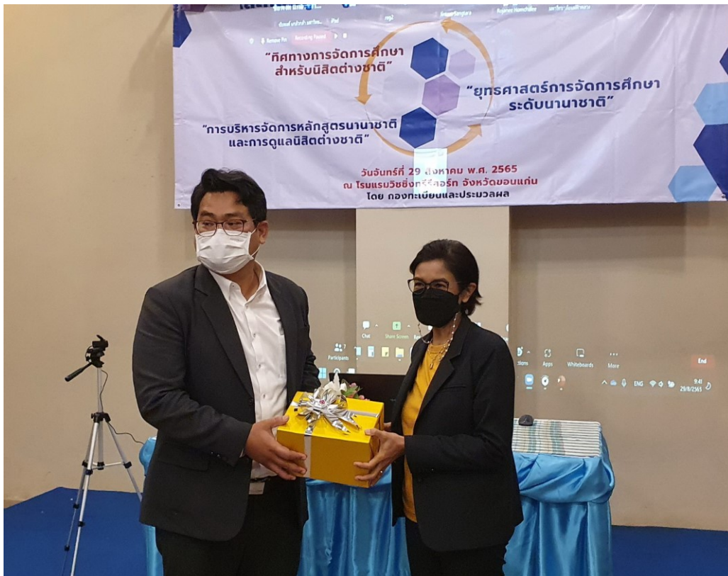
อธิการบดีมหาวิทยาลัยมหาสารคาม มอบของที่ระลึกแด่ วิทยากรผู้ทรงคุณวุฒิ